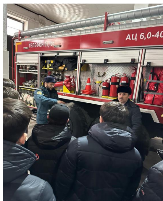
Экскурсия на профильное предприятие