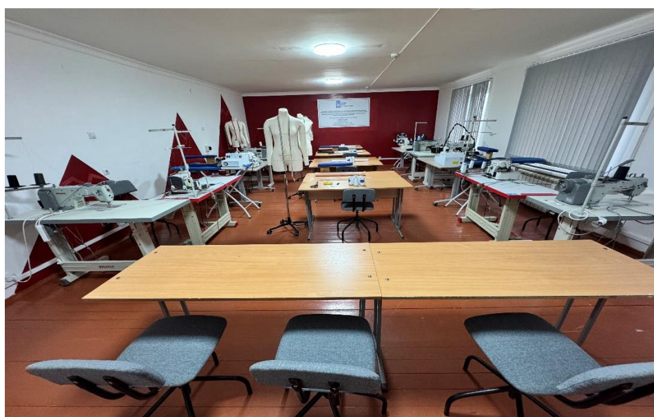
ЦПДЭ Мастер по изготовлению швейных изделий

Для проведения государственной итоговой аттестации в форме демонстрационного экзамена подготовлены и оснащены площадки (ЦПДЭ) по компетенциям: Информационные системы и программирование; Оператор информационных систем и ресурсов; Ремонт и обслуживание автомобилей; Экономика и бухгалтерский учет (по отраслям); Мастер по изготовлению швейных изделий.