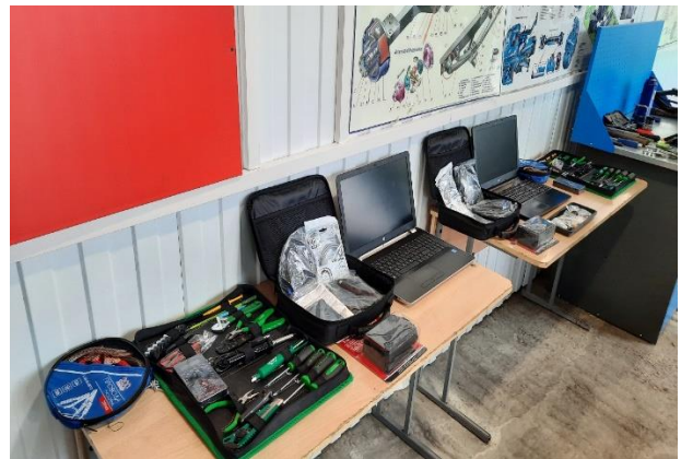
ЦПДЭ - Ремонт и обслуживание легковых автомобилей