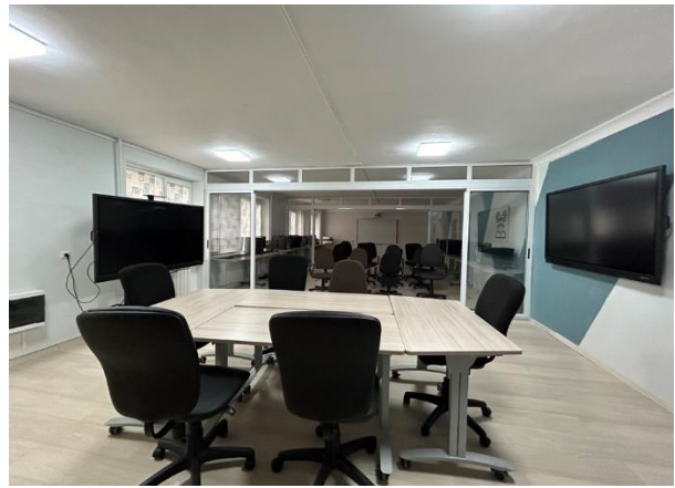
ЦПДЭ по компетенции Оператор информационных систем и ресурсов