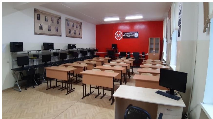
ЦПДЭ Бухгалтерский учет